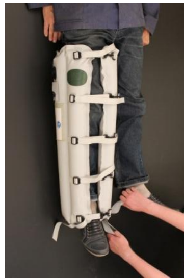
ІПШ для тимчасової фіксації нижніх та верхніх кінцівок тіла людини