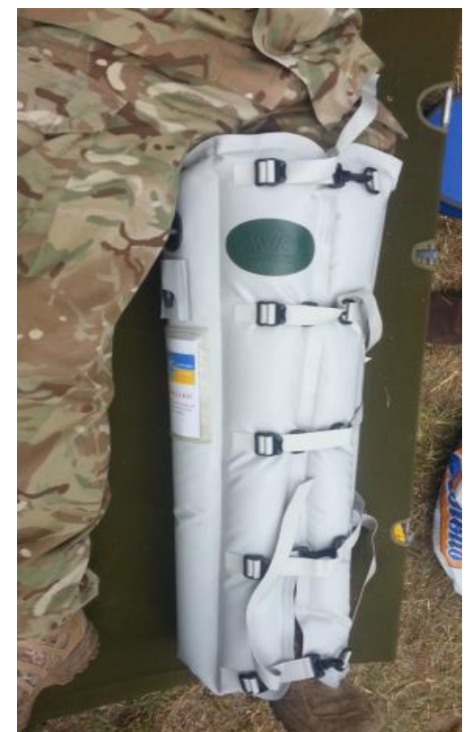
Польові випробування ІПШ

Галузь застосування: військова медицина та медицина катастроф