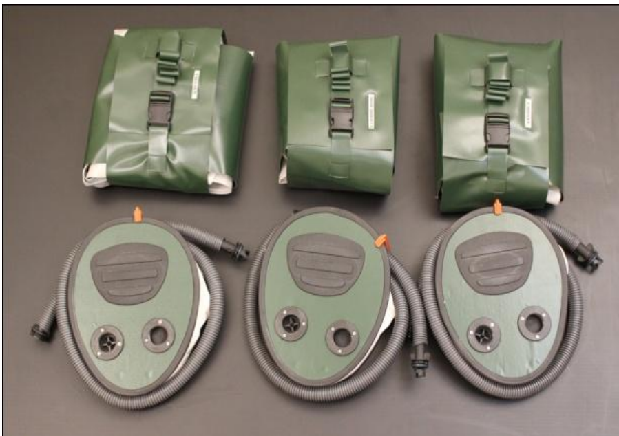
Набір медичних іммобілізаційних пневматичних шин

Апробацію ІПШ проводили за Спеціальною програмою «Військова медицина» на платформі VI Міжнародного медичного форуму «Інновації в медицині – здоров'я нації» за участю провідних спеціалістів-медиків та військових спеціалістів в галузі військової медицини.