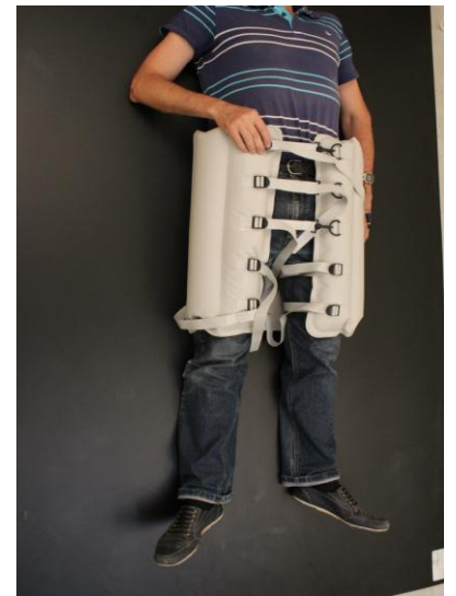
ІПШ для тимчасової фіксації тазостегнового поясу тіла людини